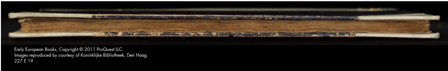
Early European Books. 227 E 19